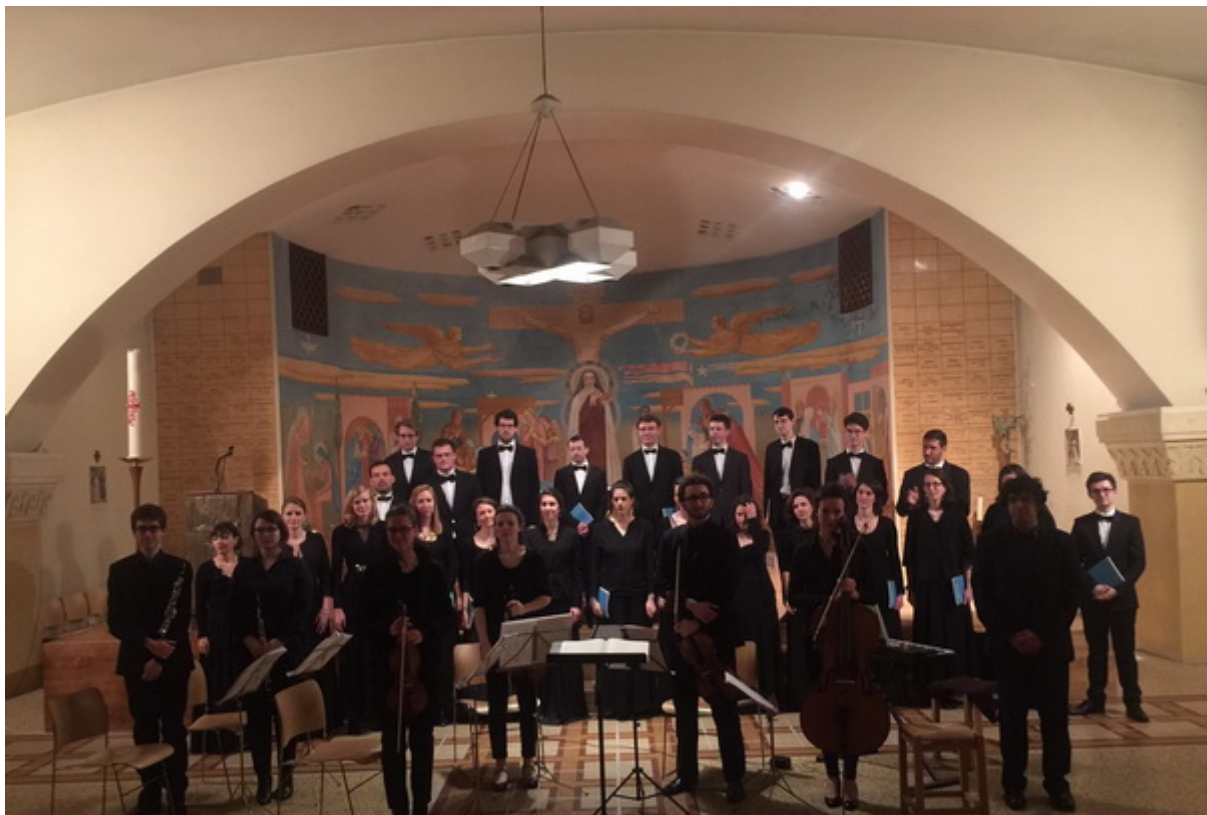
Crypte Saint-Ferdinand - Chœur Alain Charron

Nous recommandons vivement de ne pas manquer le prochain concert qui est prévu ce Mercredi 6 avril 2016 au Temple de Pentemont et d'autres dates sont à prévoir dans le calendrier pour le plus grand bonheur du public.