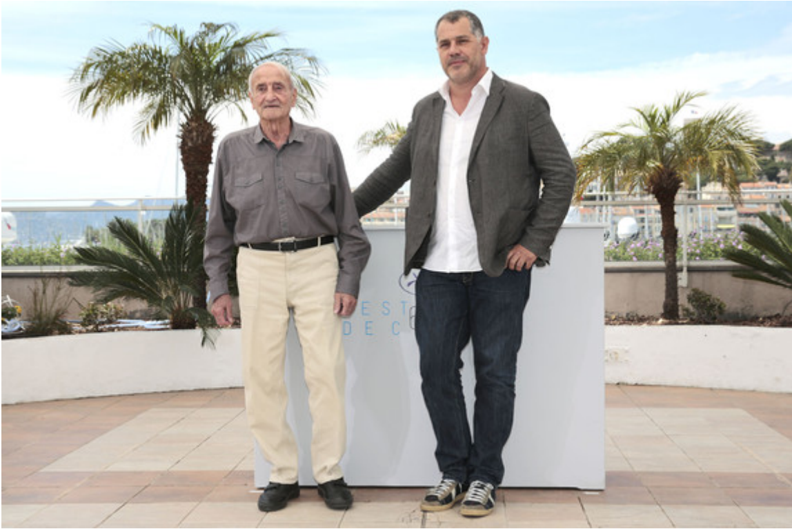
Claude Lorius & Luc Jacquet - Photocall - La Glace et le Ciel