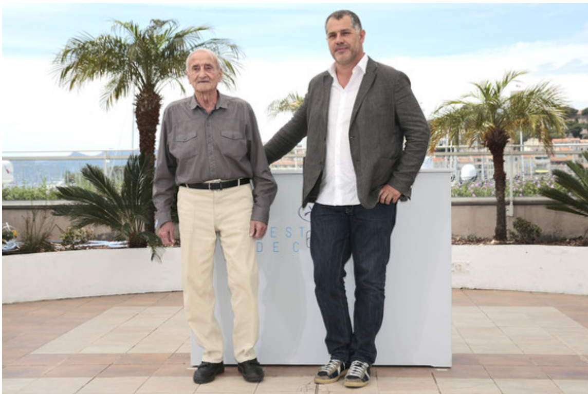
Claude Lorius & Luc Jacquet - Photocall - La Glace et le Ciel