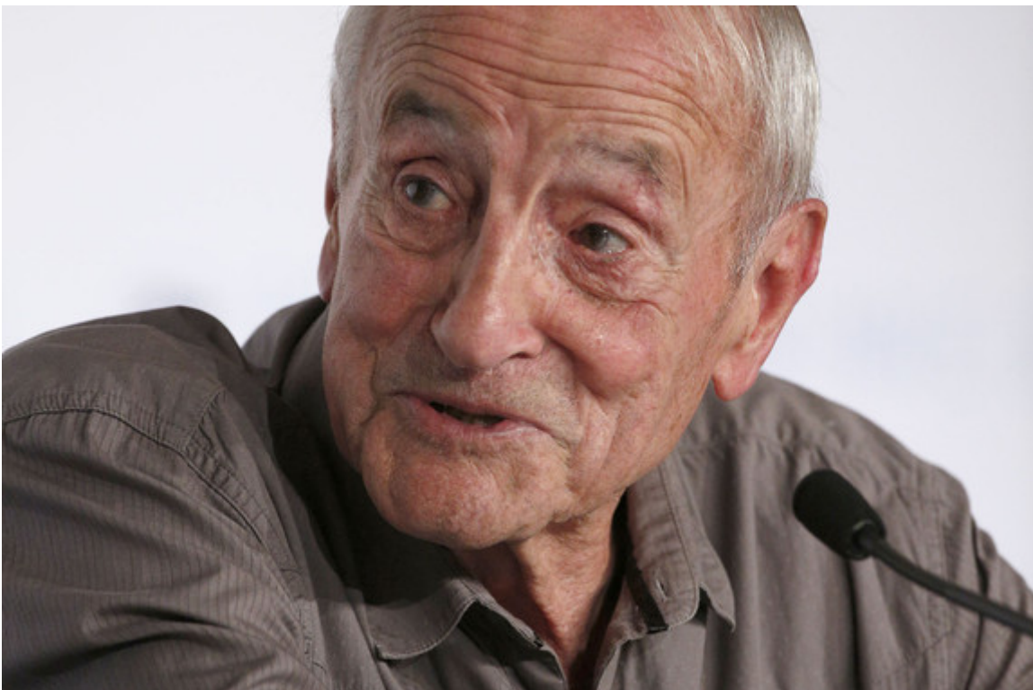
Claude Lorius - Conférence de presse - La Glace et le Ciel