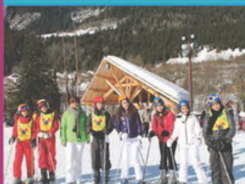
Séjour de ski