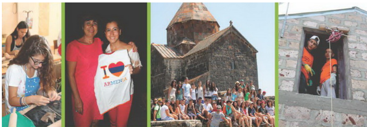
Voyage découverte en Arménie et Karabagh