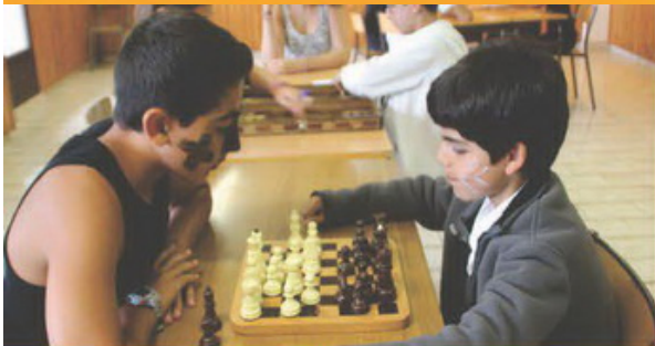
Colonie de vacances