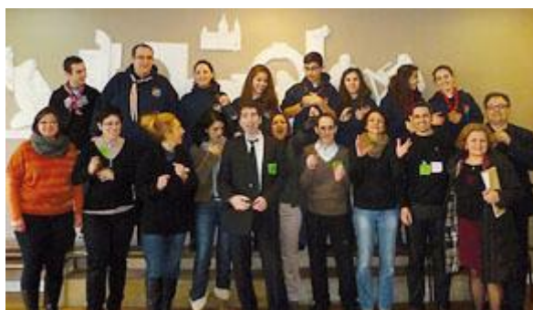
Equipe de bénévoles de l'Appel de Saint Mesrop

Ce sont plus de 30 bénévoles jeunes et moins jeunes qui appelleront près de 1.600 familles arméniennes principalement du Val de Marne afin de devenir ces parrains. L'École compte sur ces familles pour saisir cette occasion de pérenniser l'école.