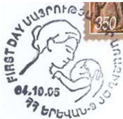
▪ Cachet du premier jour de l'émission.